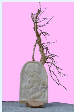
Giorgio Bernasconi, 2020