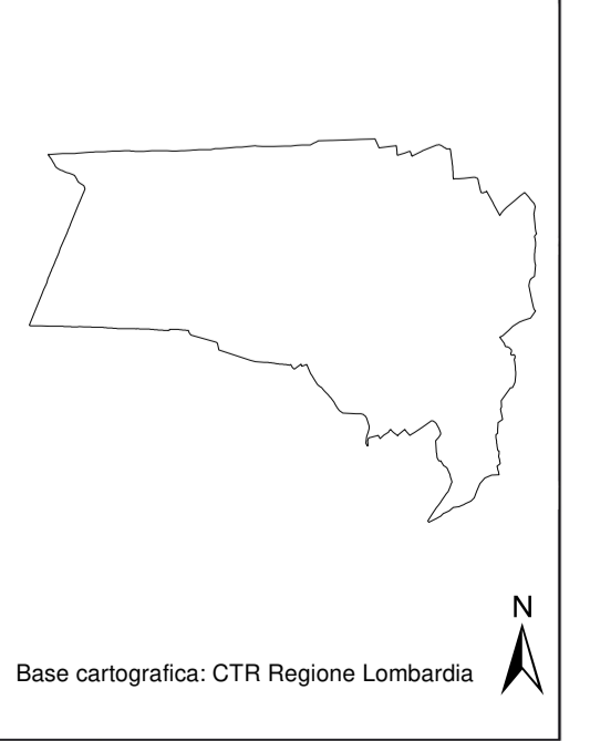
Tavola: DdP A 3 Rete Ecologica Regionale e Rete Ecologica Provinciale Tavola aggiornata a seguito accoglimento osservazioni Data: novembre 2021 Scala: 1:10.000

PIANO DI GOVERNO DEL TERRITORIO - PIANO DI GOVERNO DEL TERRITORIO PIANO DI GOVERNO DEL TERRITORIO - PIANO DI GOVERNO DEL TERRITORIO